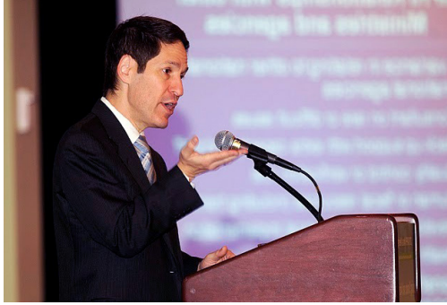
El Director de los CDC de Estados Unidos, Tom Frieden, subrayó la importancia de un enfoque nacional para los problemas de salud pública que vincule los programas nacionales con los locales.

76 institutos en 72 países, beneficiando a más del 60% de la población mundial.