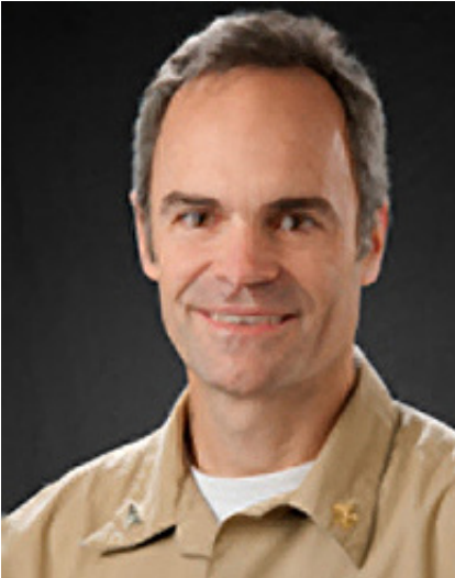
Scott Dowell, director de detección de enfermedades y respuesta global de los CDC, brindó un informe actualizado sobre las actividades de los CDC en Haití, desde el fuerte terremoto de enero hasta el brote reciente de cólera. Leer su evaluación.

Comenzando en el 2011, las cuotas de membresía serán de $500, $1,500 o $3,000 dólares de EE. UU. anuales para países de ingresos bajos, medios y altos, respectivamente. Los miembros asociados