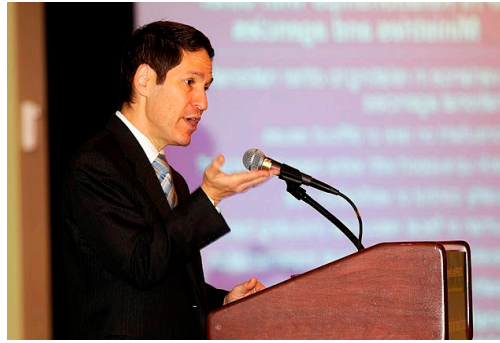
Le Dr Thomas Frieden, directeur des CDC américains, a souligné l'importance d'adopter une approche des problèmes de santé publique qui intègre étroitement efforts nationaux et programmes locaux.

L'IANPHI regroupe 76 instituts dans 72 pays, au profit de plus de 60 % de la population mondiale.